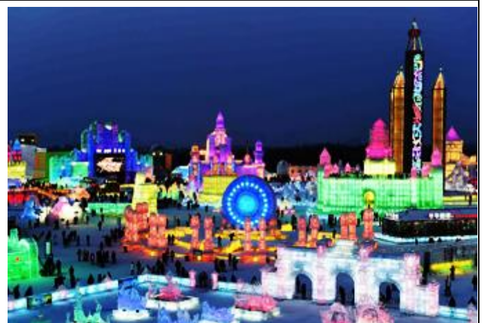
哈爾濱_室內冰雪大世界主題樂園