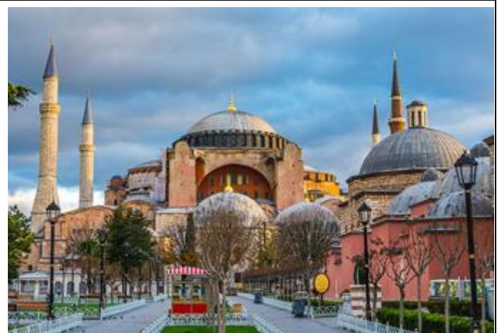
哈爾濱_聖·索菲亞大教堂