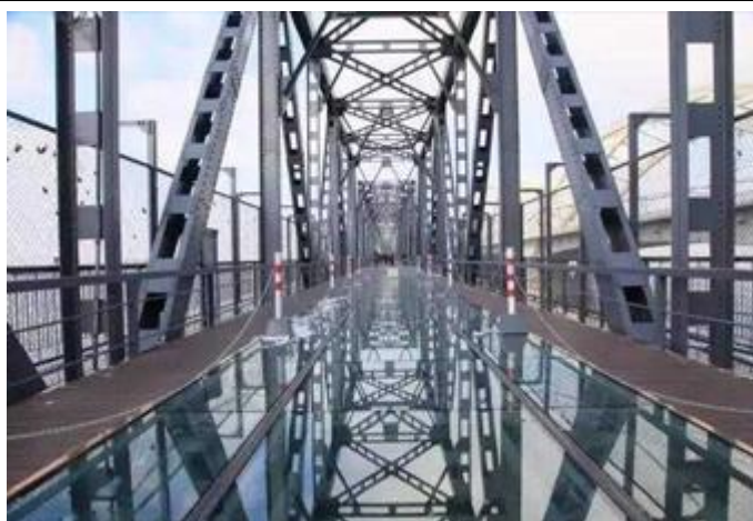
哈爾濱_百年濱州鐵路橋-玻璃棧道